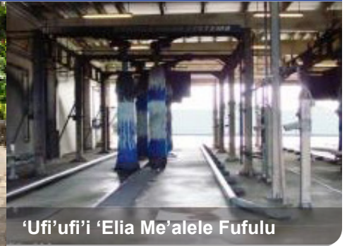
'Ufi'ufi'i 'Elia Me'alele Fufulu