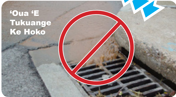
'Oua 'E Tukuange Ke Hoko

'Oku hanga he Potungäue 'o e Kolo ki he Palani pea mo e Pemitu 'o fa'u ha lao ke malu'i 'a e vaitafe pea mo e 'oseni mei hono uesia 'a e ngaahi langa. 'Oku uesia he ngaahi lao ko'eni ho poloseki 'oku kau ai 'a e ngaahi kelekele kuo veuki.