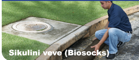
Sikulini veve (Biosocks)