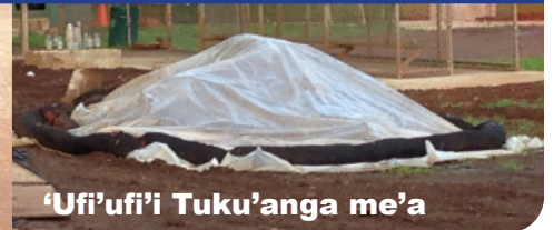
'Ufi'ufi'i Tuku'anga me'a