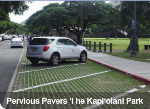
Pervious Pavers 'i he Kapi'olani Park