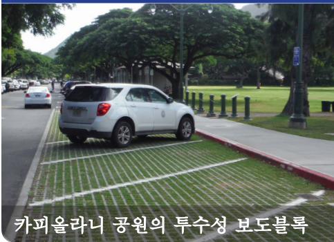
카피올라니 공원의 투수성 보도블록