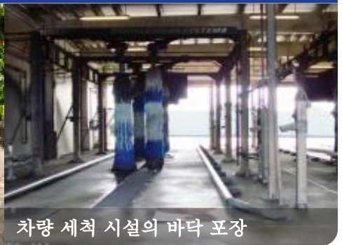
차량 세척 시설의 바닥 포장