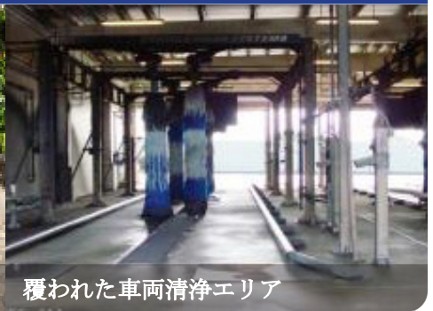
覆われた車両清浄エリア