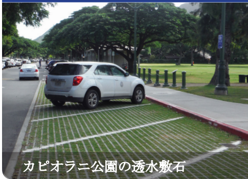
カピオラニ公園の透水敷石