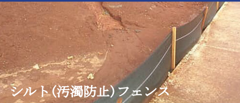
シルト(汚濁防止)フェンス