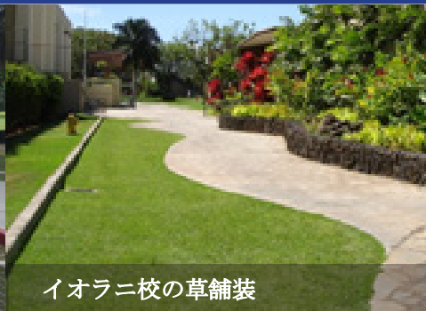
イオラニ校の草舗装